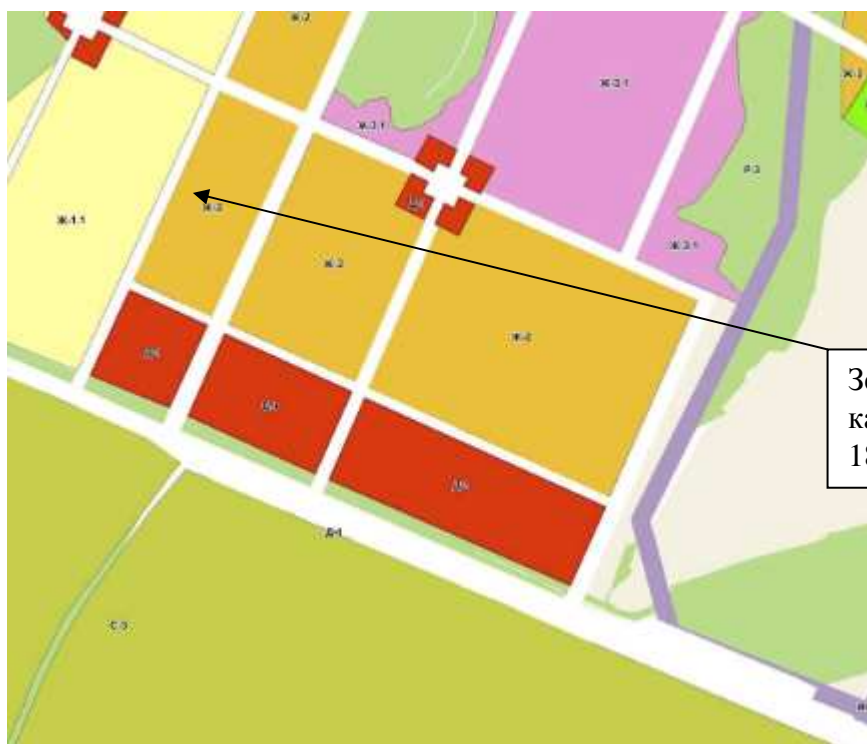
Рис.2. Выкопировка из ПЗЗ г.Воткинска.

Предельные размеры земельных участков, предельные параметры разрешенного строительства, реконструкции объектов капитального строительства зоны Ж-2, применяемые для объектов индивидуального жилищного строительства (код 2.1):