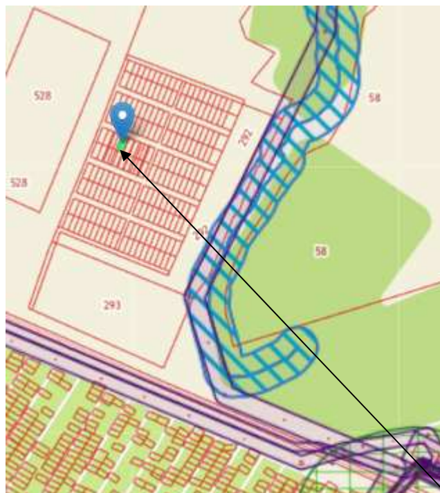
Рис.3. Выкопировка из публично – кадастровой карты земельных участков города Воткинска

Земельный участок с кадастровым номером 18:27:070002:518